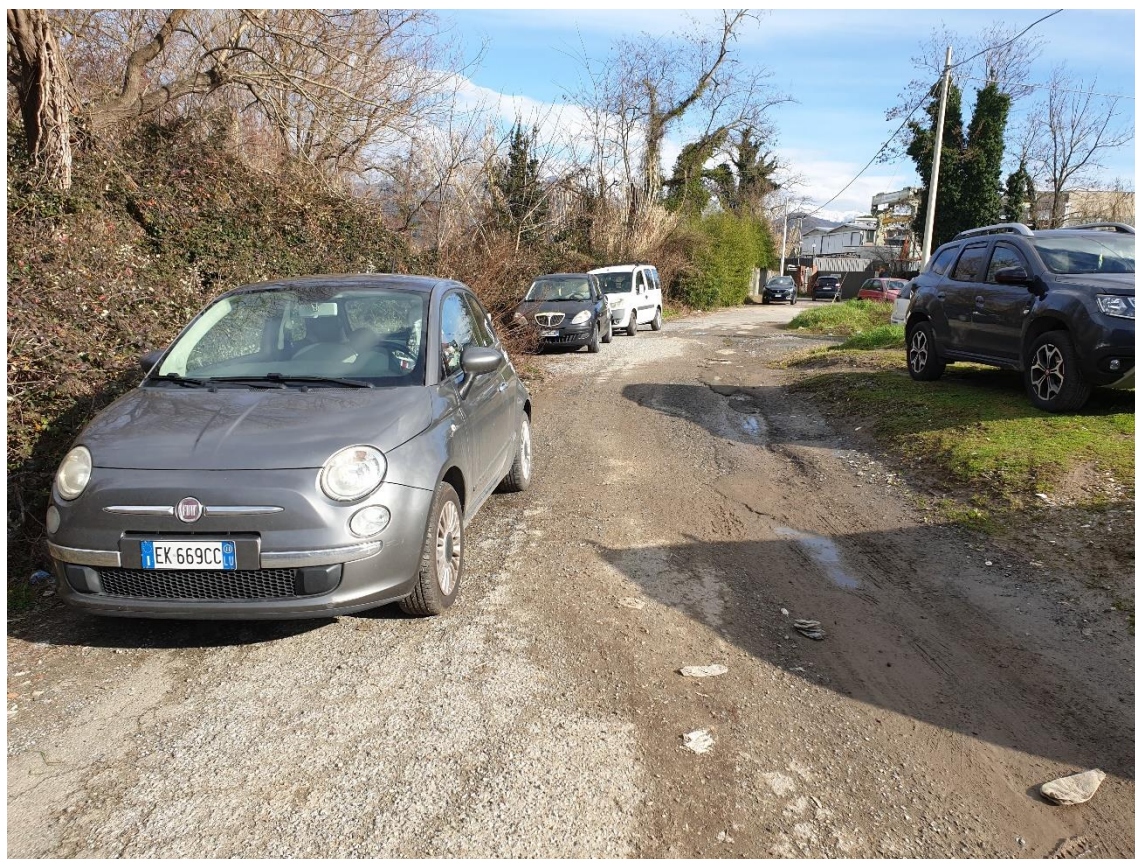
Foto 3 – parcheggio attuale con presenza di piccoli rilevati in terra