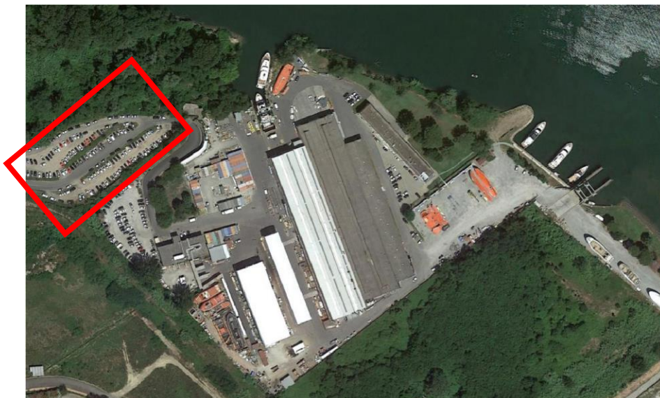
Figura 1 - foto aerea dello stabilimento produttivo di Sanlorenzo Spa