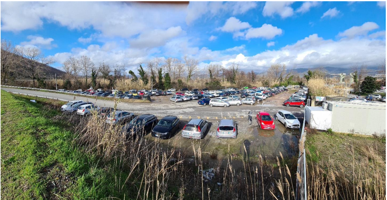
Foto 1 – panoramica del parcheggio visto dalla testa dell'argine lotto 3