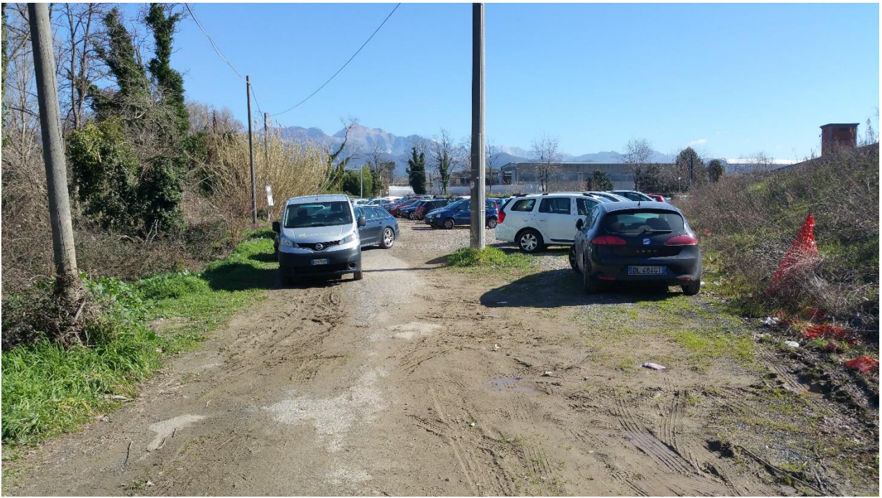
Foto 4 – parcheggio attuale con presenza di piccoli rilevati in terra